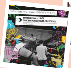
PRATIQUES COLLECTIVES 23 MARS