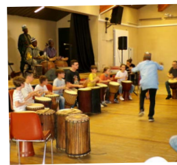
TAMBOURS QUI PARLENT DU MARADI 10 MAI