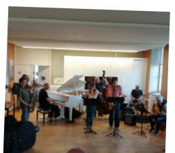
JAM SESSION RDV DE L'ERDRE - 5 JUIN