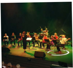
L'EMI AU CARRÉ D'ARGENT - 8 JUIN