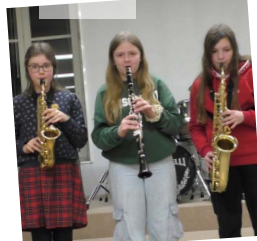
CLARINETTE / SAX 22,29 JANVIER & 5 FÉVRIER